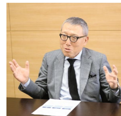
サーラグループ代表

まずは一歩踏み出して、皆さんの日々のひらめき、アイデアをぜひエントリーしてください。皆さんと一緒に新しいサーラ、未来のサーラを創りあげていけたらと思っています。皆さんからのアイデアをお待ちしています。